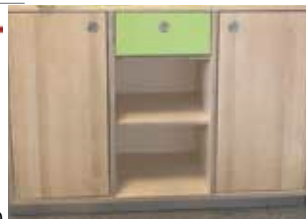
z.B. Sideboard individuell gefertigt