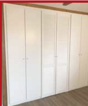
z.B. Begehbarer Schrank mit Lamellentüren